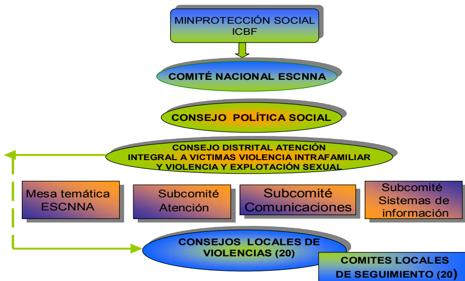
GRÁFICO 1 INSTANCIAS QUE INTERVIENEN EN LA PREVENCIÓN, ATENCIÓN Y ERRADICACIÓN DE LA ESCNNA

Elaborado por la Subdirección de Análisis Sectorial –Dirección Salud y Bienestar Social Contraloría de Bogotá.